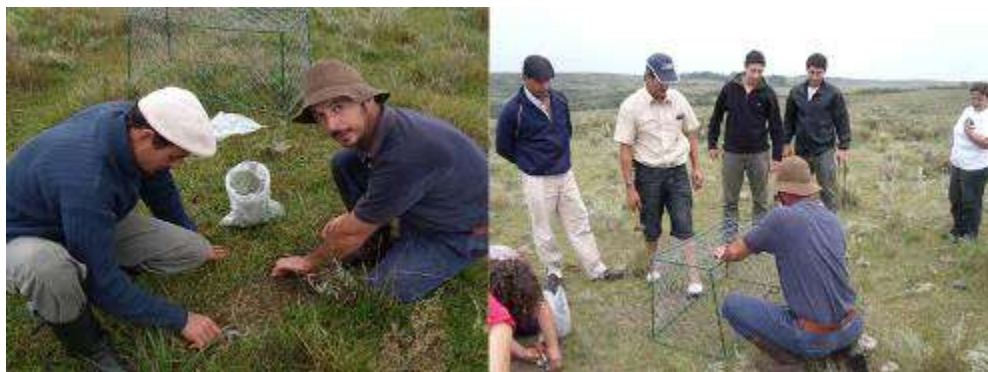
Figura 3. Imágenes del trabajo de campo en el predio de la CAQC en el marco del segundo taller. (2011).

El segundo taller, tuvo lugar en marzo de 2011, en el Establecimiento “El Capricho”, se expusieron las bases metodológicas para estimar la producción de forraje a través del uso combinado de cortes de biomasa vegetal e información satelital. Posteriormente, se instaló el ensayo de campo en los cuatro sitios seleccionados con la participación activa de todos los presentes en el taller (Figura 3). A partir de la instalación del ensayo, los muestreos se realizaron estacionalmente, entre junio de 2011 y junio de 2012. El procedimiento a campo, llevado a cabo fundamentalmente por investigadores y productores, comprendió el corte de vegetación, embolsado y etiquetado. Posteriormente en el laboratorio los investigadores realizaron el procesamiento del material vegetal (Pezzani et al., 2017).