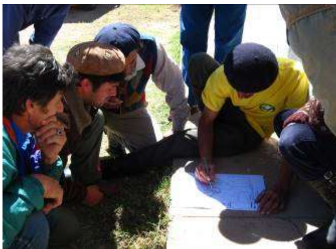
Figura 2. Muestra de trabajo grupal durante el primer taller en el Establecimiento Huija (Ministerio de Defensa Nacional).(2010).

El primer taller tuvo lugar en el Establecimiento "Huija" (Ministerio de Defensa Nacional) en diciembre de 2010. Se presentó la propuesta de trabajo a la comunidad local y se expusieron conceptos clave sobre la ecología de pastizales y la producción ganadera en base a pastizales naturales. Técnicos de Aves Uruguay y del Instituto Plan Agropecuario (IPA), además de los investigadores de la UdelaR, fueron expositores en este encuentro. Posteriormente, los participantes se organizaron en pequeños grupos integrados por representantes de diversas agrupaciones y/o instituciones. Se les propuso una secuencia de trabajo en base a consignas preestablecidas relacionadas a la identificación de zonas diferentes de vegetación sobre un mapa del área (Figura 2). En función de los resultados obtenidos en el primer taller, se realizó la selección de los sitios de muestreo para la obtención de datos de producción de forraje.