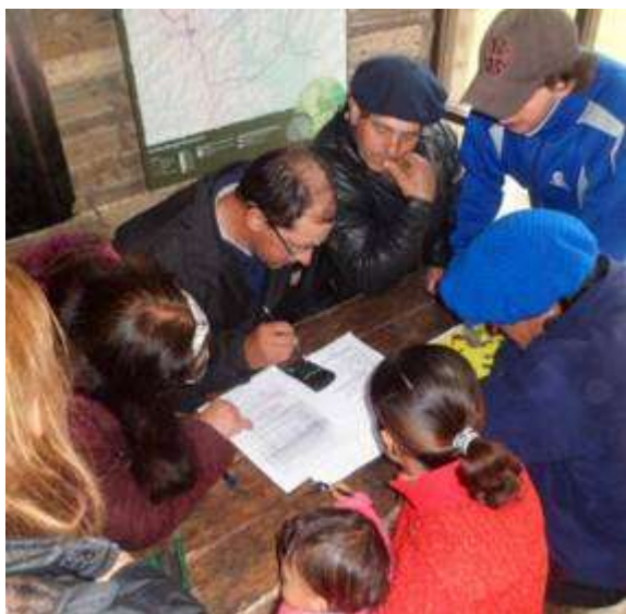
Figura 4. Muestra del trabajo grupal de estimación de capacidad de carga durante el cuarto taller en el Centro de interpretación ambiental del PPQC. (2014).

etapas del proyecto, se identificaron resultados y logros obtenidos así como fortalezas y debilidades del proceso e impactos tanto a la interna de la organización como a través del vínculo con otras organizaciones y/o instituciones.