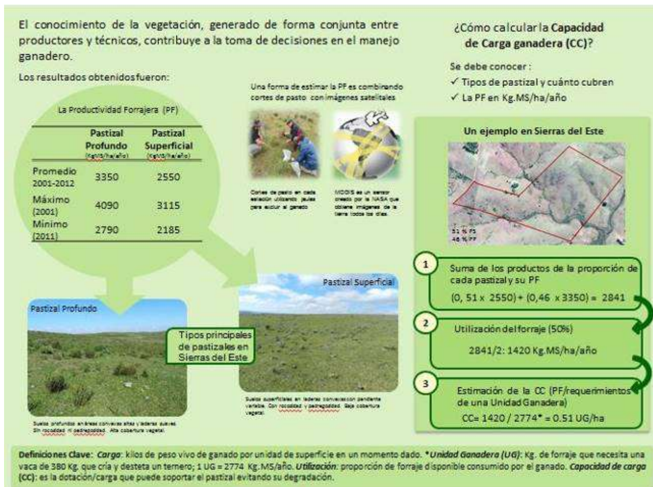
Figura 5. Imagen interna del folleto generado en el marco del proyecto. Se detallan los principales resultados y procesos realizados.