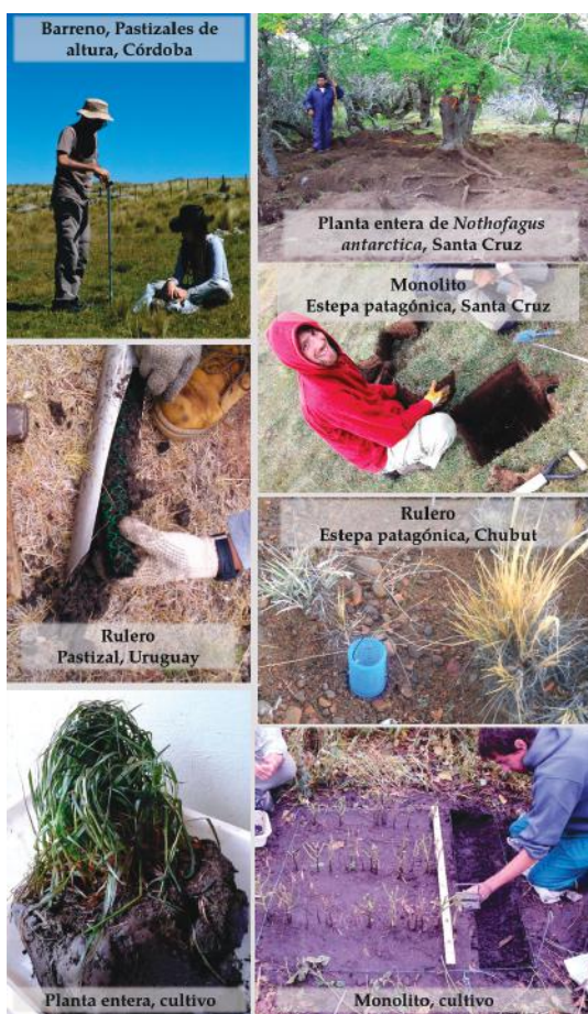
Figura 2. Métodos de muestreo empleados en distintas regiones de la Argentina y de Uruguay para obtener la fracción vegetal subterránea en sistemas naturales y en cultivos.

La elección del método de muestreo y el diseño experimental parecería estar basada en los métodos empleados previamente en el sistema de estudio de cada grupo de investigación. Es posible que esta decisión se relacione con la posibilidad de obtener resultados comparables, además de que el método esté avalado por trabajos científicos anteriores. Si bien se podría considerar que la asignación aleatoria de las parcelas de muestreo resulta más sencilla en sistemas de pastizales que en arbustales, estepas o bosques, la mayoría de las investigaciones ubican las parcelas de manera sistemática en todos los ecosistemas. La cercanía y el tamaño de los individuos parecería ser determinante tanto para muestrear cerca (e.g., bosques, arbustales, estepas) o lejos de ellos (e.g., pastizales, estepas). Por otra parte, aunque se conoce que el período del año de máxima productividad de raíces puede no coincidir con el de la productividad aérea, tal como ha sido registrado en la estepa patagónica (Soriano et al. 1987) y en pastizales (López-Mársico et al.